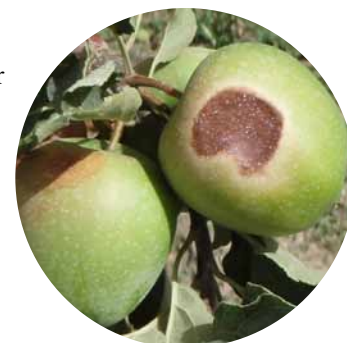
Manzana quemada por el sol

La luz solar, si bien es esencial para la salud de los huertos de manzanas, un exceso de ella algunas veces podría ser contraproducente. La luz solar excesiva puede quemar o descolorar la fruta, y las temperaturas altas pueden estresar los árboles, reduciendo su productividad general. Las pérdidas producidas por el daño solar y el estrés solar podrían reproducirse rápidamente y recortar las ganancias del agricultor. Temperaturas en las frutas de entre 114° y 120° F podrían causar daños por quemaduras de sol. Aplicando Purshade® se puede disminuir la temperatura de la cáscara de la manzana en 10° F o más, y la temperatura de la superficie del árbol en 5° a 10° F. Además, la película protectora de Purshade sobre las superficies de las plantas aumenta la refracción de la luz dentro de la bóveda de copas, lo que mejora el color de las frutas.