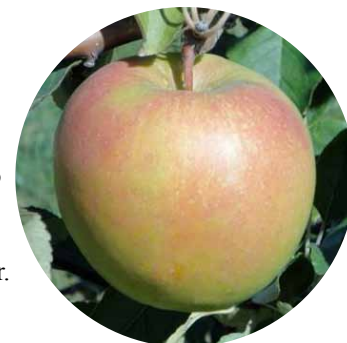
Granny Smith con tono rosáceo por quemadura de sol

Purshade reduce el estrés solar de los cultivos protegiendo el follaje y también protege el fruto del daño que causa la radiación ultravioleta (UV) e infrarroja (IR), además de permitir que se produzca la fotosíntesis. Se ha comprobado que Purshade, diseñado con tecnología de reflectancia de avanzada y basado en carbonato de calcio, un mineral altamente reflectante, reduce el daño por quemaduras de sol y minimiza el estrés general causado por el calor. Purshade refleja en forma eficaz la pernicioso radiación UV e IR, alejándola de las plantas.