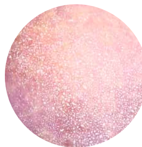
Muestra de cobertura ideal