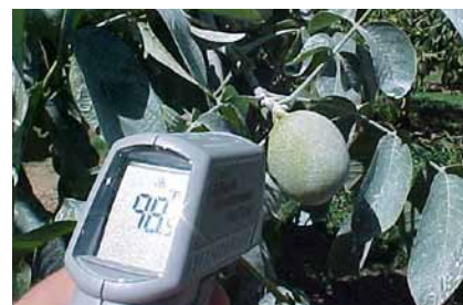
Una película protectora de Surround reduce la temperatura de las nueces expuestas al sol.

TESSENDERLO KERLEY, INC. 2255 North 44th Street Suite 300 Phoenix, AZ 85008-3279